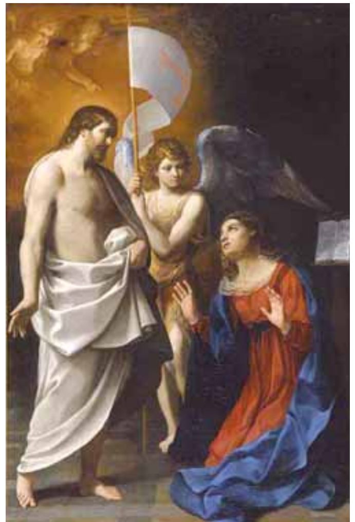
Gesù risorto appare a Maria Santissima.