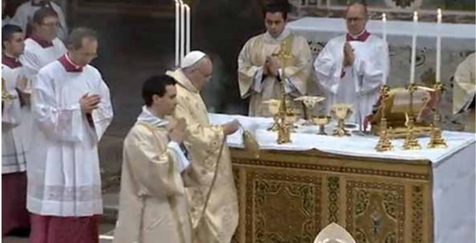
Francesco celebra, nella Cappella Sistina, la sua prima Messa pubblica con l'altare rivolto verso il popolo.

decise di tornare a Santa Marta in pullmino, insieme ai suoi elettori. La macchina ufficiale non sarebbe stata usata neppure la mattina seguente, per la visita a Santa Maria Maggiore , quando Francesco preferì sedersi sul sedile posteriore di una modesta berlina. Uno stile semplice e personale ribadito anche ieri, durante l'udienza ai cardinali nella Sala clementina. Oltre al candido bianco della talare, Francesco si è concesso solo un'altra nota di colore: un braccialetto giallo che il cardinale sudafricano Fox Napier gli ha donato e che lui, senza esitazione, si è allacciato al polso, con l'aiuto di un divertito Georg Gänswein, prefetto della Casa pontificia». (dal "Foglio Quotidiano" 16.3.2014, di Matteo Matzuzzi)