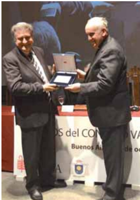
Il card. Bergoglio e il rabbino Abraham Skorka.

Ora, se Guardini è stato un modernizzante, e lo è stato, è stato anche il caposcuola di Ratzinger, Hans Urs von Balthasar e della Rivista "Communio" , dal 1972 contraltare modernista moderato della Rivista " Concilium " (1964), avanguardia del modernismo radicale (Rahner, Küng, Schillebeeckx), ed ha influito non poco sulla sensibilità estetizzante di Benedetto XVI, circa la Messa tradizionale.