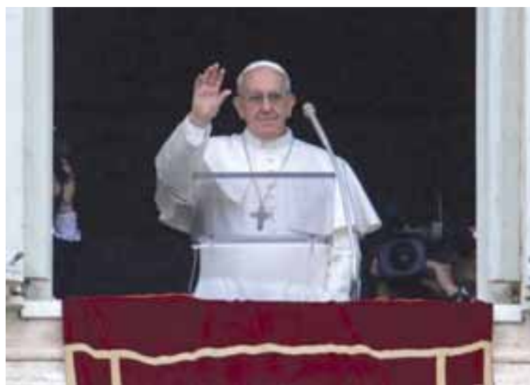
Francesco “Vescovo di Roma”.

« R oma, 13 marzo 2013. Tutto, fino alla prima apparizione di Papa Francesco dalla Loggia delle Benedizioni mercoledì sera, aveva seguito fedelmente il copione meticolosamente preparato dal maestro delle Cerimonie liturgiche, Guido Marini. I drappi rossi che rivestivano le colonne ai lati della grande vetrata, le tende tirate, le luci accese sulla piazza gremita. Le campane che, a differenza dell’ultimo Conclave, non si erano fatte attendere e avevano immediatamente confermato che la fumata era bianca.