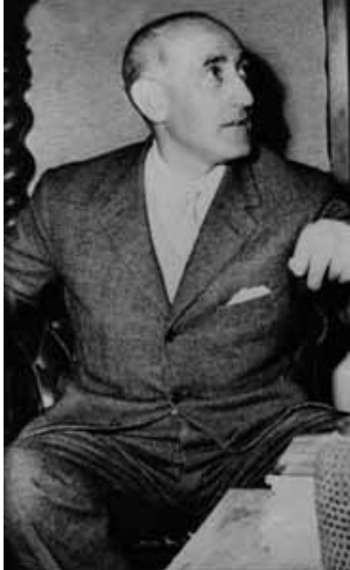
Il Marchese Ugo Montagna, il burattinaio del “caso Montesi”.

Fu arrestato anche Ugo Montagna, che era stato protetto