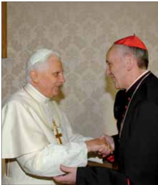
Benedetto XVI col card. Jorge Bergoglio.

Ciò che è accaduto a Cuba durante la rivoluzione castrista, alla quale collaborarono anche numerosi cattolici, pur se con finalità diverse, è un esempio tipico del risultato a cui porta la collaborazione con i comunisti e dovrebbe farci riflettere. I Comunisti come i Modernisti, infatti, non disdegnano la collaborazione dei cattolici. Anzi, la sollecitano (v. Antonio Gramsci, Ernest Bloch e Palmiro Togliatti), la provocano anche, mettendo in evidenza miseria e ingiustizie che possano suscitare l'indignazione e la reazione degli spiriti retti . E purtroppo, spesso, ottengono la collaborazione desiderata. Abituati ad agire in buona fede, i cattolici tendono molte volte a giudicare impossibile che, rispetto a considerazioni umanitarie, qualcuno possa nascondere un fine perverso. Finiscono, così, per impegnarsi, non per il movimento comunista, ma per la lotta a favore degli infelici, degli oppressi e dei sofferenti . E lavorano uniti, cattolici e comunisti, i primi certi che gli altri, come loro, desiderino sinceramente curare la società dalle piaghe che la infetta-