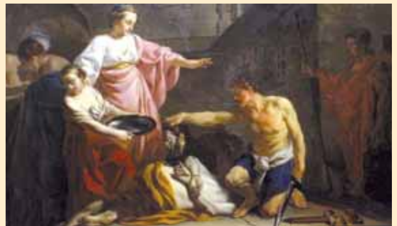
La decapitazione di San Giovanni Battista. Il risultato della sensualità di una danza.

Noi ci chiediamo soltanto: ma era riuscito il Diavolo a pensare che, un giorno, per "sala da ballo" si sarebbe potuta utilizzare l'area davanti all'altare di una chiesa cattolica?